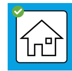
bei positivem Test Isolation, bei Kontakt Quarantäne